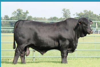
BIG TOWN Pai