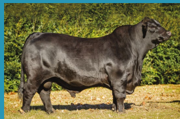
FRANCESCO Avô materno