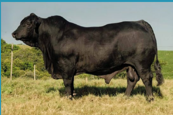
PANTHEON Irmão materno