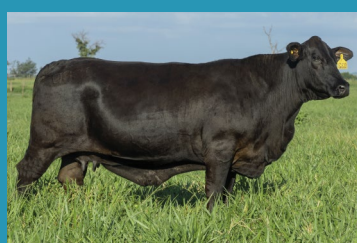
032L Irma própria da doadora