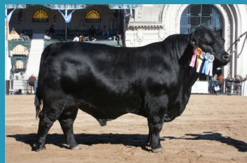
SUMAJ Avô paterno