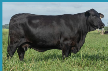
N194 Irmã própria da doadora