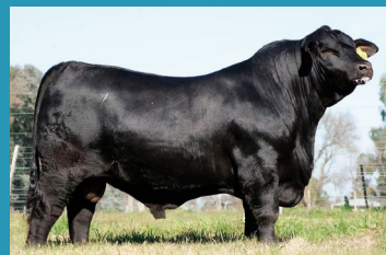
ARANDU Avô paterno