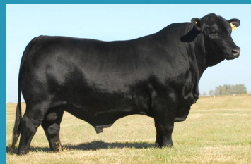
LONQUIMAY Avô paterno