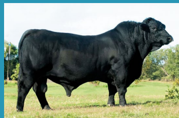
CURUPAY Avô materno