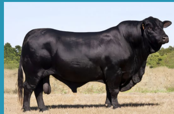
GLADIADOR Bisavô materno