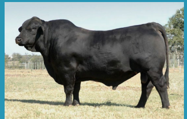
BRINKS BRIGHTSIDE Bisavô materno