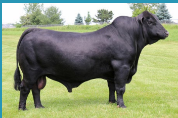
SUHNS FINAL CUT