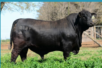
SHOW BUL Pai