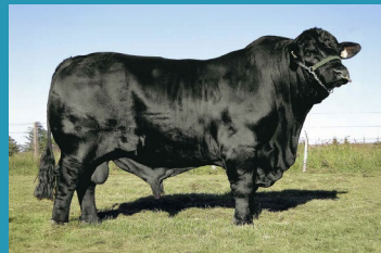
SPARTACUS Avô materno