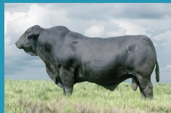
SLEEP EASY Avô materno