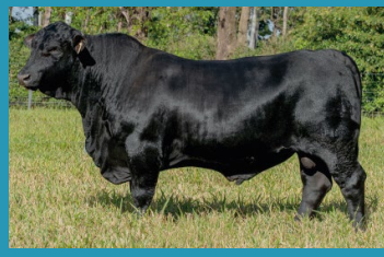
ARES Irmão materno