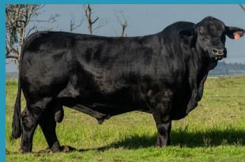
PROFETA Avô materno