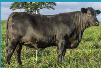
R062 Irmã materna da doadora