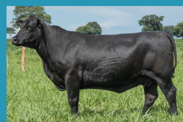
094J Irmã materna de doadora